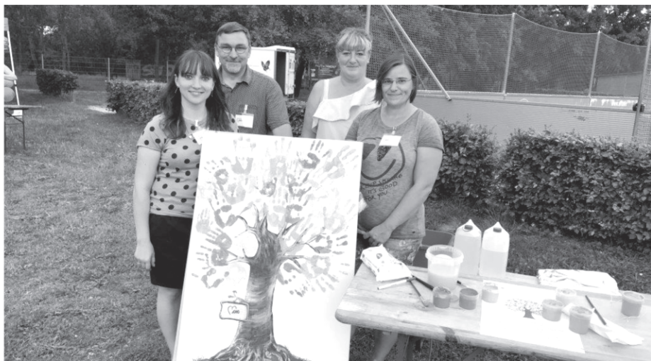
Foto: Das Team vom AWO Seniorenzentrum „Am Heiligenberg“ ließ Festteilnehmer aus bunten Hand-Abdrücken einen „Baum des Miteinanders“ gestalten. Die Idee fand bei den Besuchern viel Anklang.

Beim traditionellen Stadtteilstfest in Jena-Nord am 30. August 2019 war der AWO Regionalverband Mitte-West-Thüringen e.V. mit einem breiten Angebot vertreten. Das Team der AWO Wohnberatung beantwortete Fragen zum Thema altersgerechtes Wohnen und gab interessierten Besucher*innen Tipps, wie sich die eigene Wohnung an