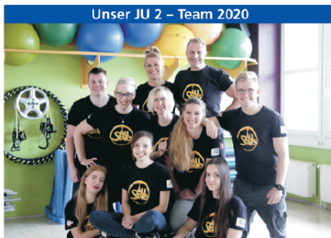
Unser JU 2 – Team 2020